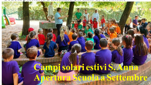
Campi solari estivi S. Anna Apertura Scuola a Settembre

La Fondazione 'Madonna del soccorso' Onlus ringrazia la Diocesi di S. Miniato per il contributo 8 per mille erogato per sostenere i progetti di carità, la riduzione delle rette della Rsa e della Scuola e per i sacerdoti in difficoltà. La Fondazione coglie l'occasione per ringraziare anche la Fondazione Cassa di Risparmio di Volterra per il contributo erogato al progetto 'Con i nonni' per l'attivazione del Centro diurno con attività di agricoltura sociale presso la Rsa Madonna del soccorso di Fauglia. Si ringrazia ancora la Fondazione Tangorra per il bellissimo progetto realizzato nell'anno scolastico 2021-22 presso la Scuola paritaria d'infanzia S. Anna di Orentano