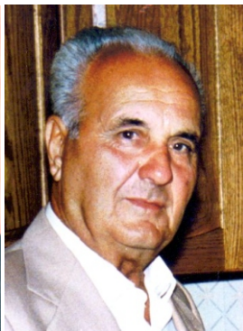
BRILLANTE AGRUMI 29-10-1994