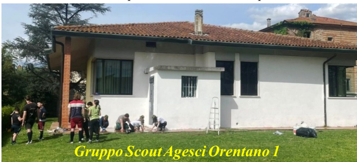
Gruppo Scout Agesci Orentano 1