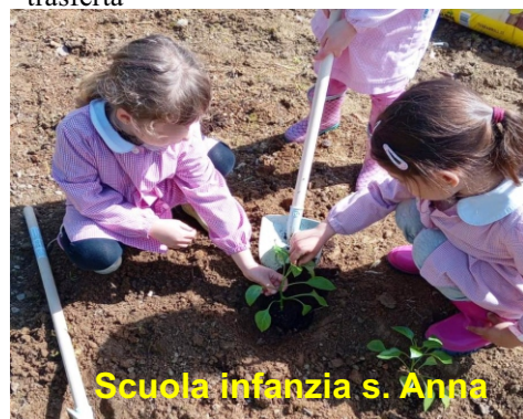
Scuola infanzia s. Anna

Le nostre domeniche sono per loro e con loro! Gruppo mini volley Orentano, in trasferta