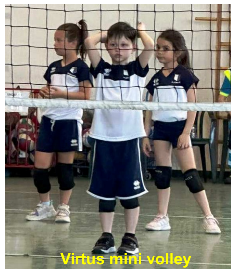
Virtus mini volley

Da chi ti custodisce nel cuore e nell'anima. "