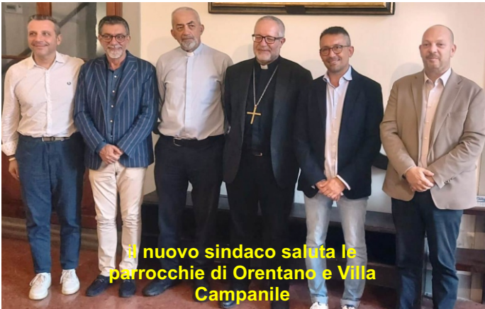
Il nuovo sindaco saluta le parrocchie di Orentano e Villa Campanile